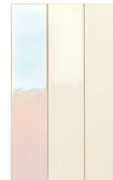
4100729 CREAM HOLOGRAM