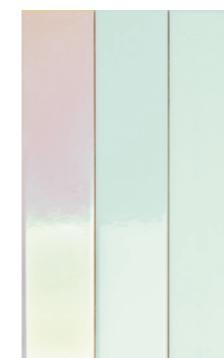
4100731 SKY HOLOGRAM