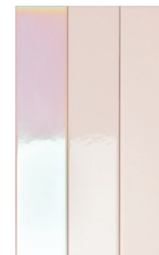
4100730 ROSE HOLOGRAM