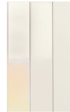
4100732 MILK HOLOGRAM

Inside each Hologram mix box there is a 24% Hologram finish, a 38% Matte finish and a 38% Glossy finish. The Hologram finish recreates the light spectrum through a glazing of precious metals. Each piece has different gradients with accumulations on the edges that are a peculiar feature of the product. The colours of the pieces may vary with shades of yellow/green, green/blue, yellow/orange, yellow/pink up to fuchsia and metallic blue. Each piece changes in colour and reflectivity depending on where you look at it and the changing of light. We recommend laying the product never putting two pieces of Hologram close together but mixing them between the matte and glossy finishes. We recommend using white cement grout joints. We recommend not using aggressive acids for cleaning but supermarket products. Do not use abrasive sponges as they can scratch the product surface.